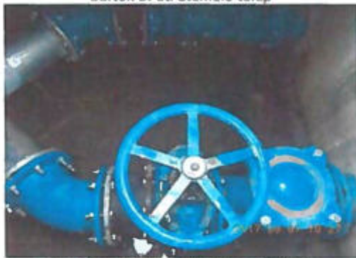
Bartók B. úti szerelvényakna gépészet