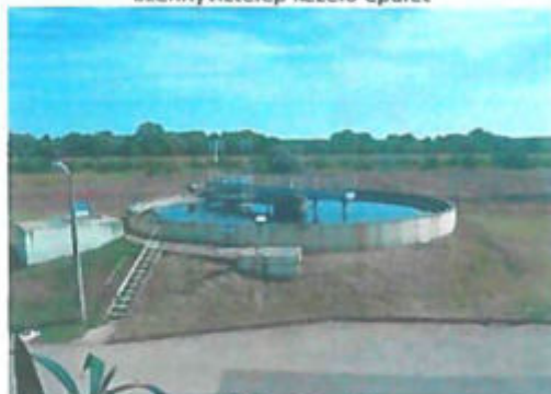
Dorr utóülepítő medence