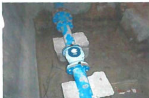
Átadó akna I. vízmérő