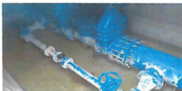
Átadó akna II. vízmérő és gépészet