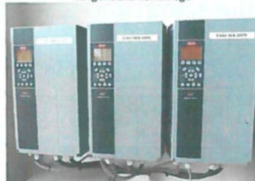
Recirkulációs szivattyúk frekvenciaváltói