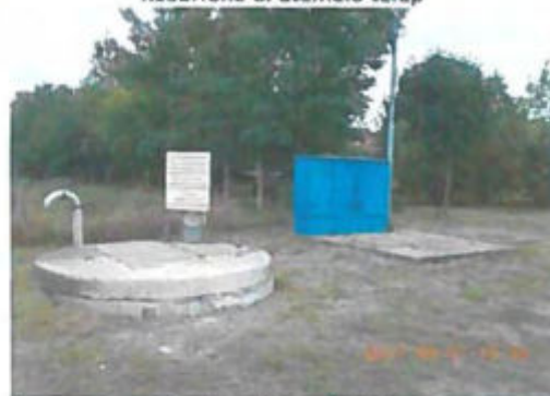
Szeder u. átemelő telep