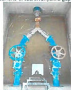
Szeder u. szerelvényakna gépészet