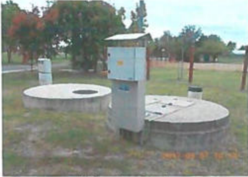
Téglás u. átemelő telep