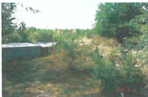
Átadó akna I.