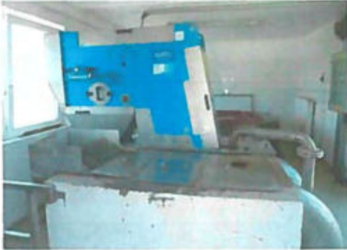
Kézi és gépi rács