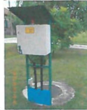
Ladik u. átemelő és elektromos szekrény