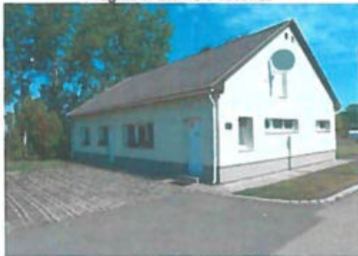
Szennyvíztelep kezelő épület