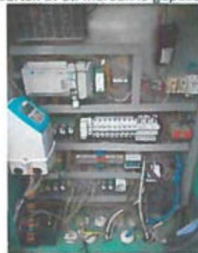
Bartók B. úti átemelő vezérlés