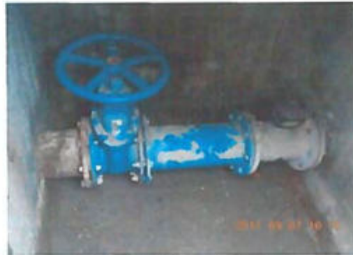
Bartók B. úti mérőakna gépészet