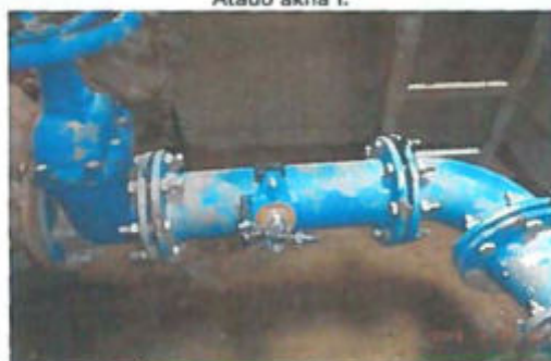
Átadó akna I. gépészet (rész)