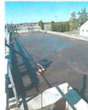
Szennyvíztelep biológiai műtárgy sor