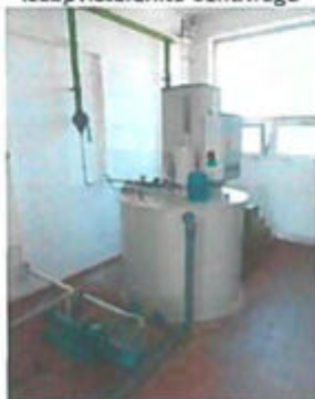
Polielektrolit oldó és adagoló berendezés