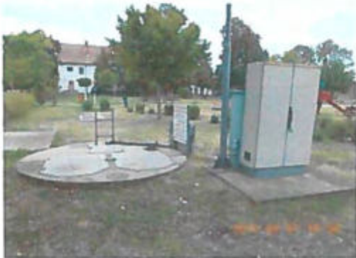
Bartók B. úti átemelő telep