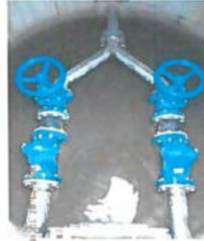
Téglás u. szerelvényakna gépészet