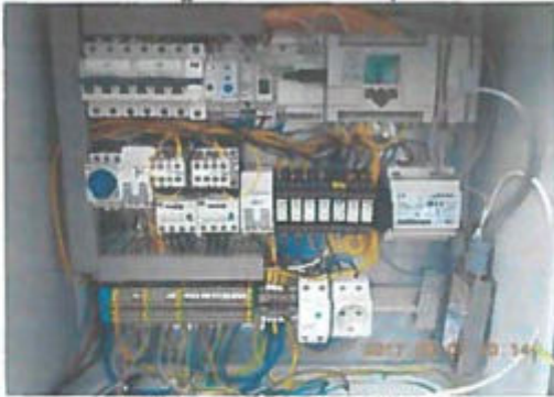
Téglás u. átemelő vezérlés