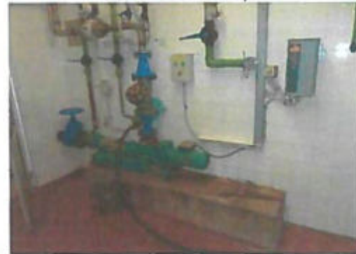
Iszapfeladó szivattyú frekvenciaváltóval