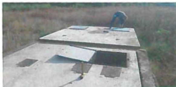
Átadó akna II.