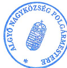
Molnár Áron polgármester

A handwritten signature in blue ink, appearing to be 'AM'.