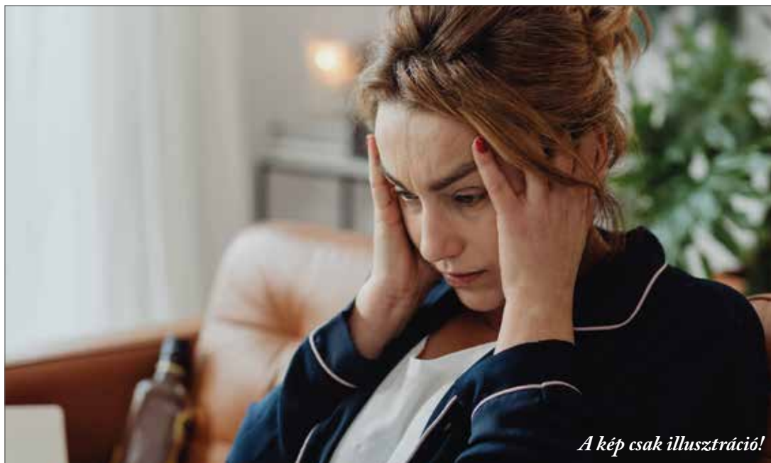
A kép csak illusztráció!

háziállatok, növények közelsége, a digitális detox mentesít a megterhelő ingerektől -. Az egészséges életvitel mellett sokaknak segítséget nyújtanak a relaxációs és légzéstechnikák is: ezeknek számtalan formája elérhető - pl. vezetett relaxációs