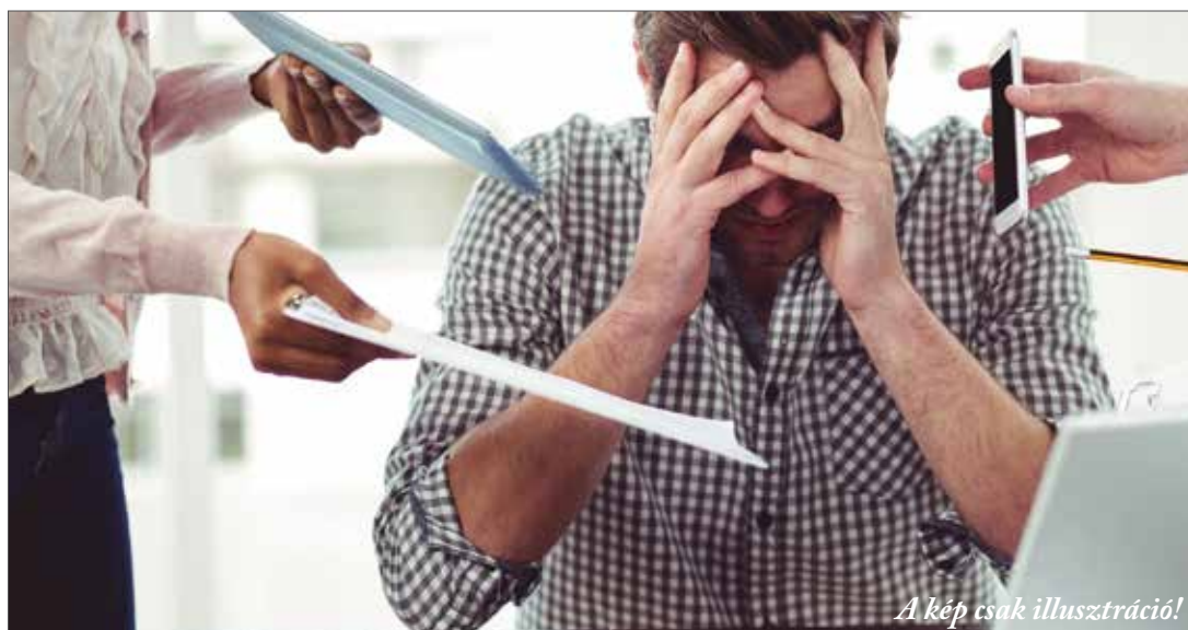
A kép csak illusztráció!

Ön szerint miért érezzük ma olyan sokan úgy, hogy állandóan rohanunk és stressze-lünk?