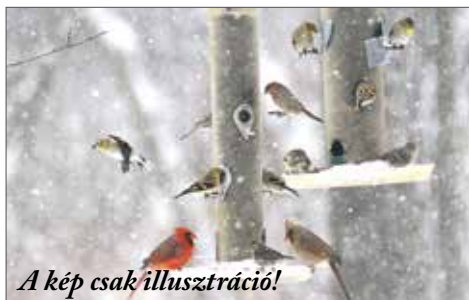
A kép csak illusztráció!

A január a kertben általában a csend időszaka, de ez nem jelenti azt, hogy nincs teendő. Bár a legtöbb növény pihen, a kertész már ilyenkor is sokat tehet azért, hogy tavasszal egészséges, rendezett kert várja.