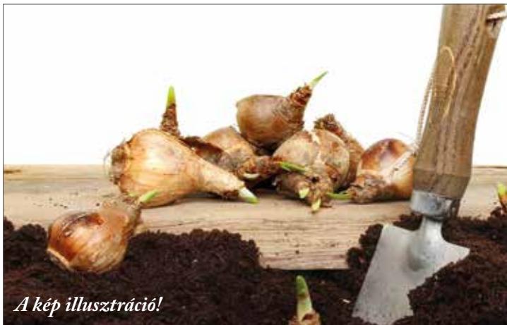
A kép illusztráció!

Az október nemcsak a színes lombok és a hűvösebb reggelek hónapja, hanem a kertészkedés szempontjából is kiemelten fontos időszak. Ha most rászánunk néhány kellemes őszi délutánt, tavasszal egy egészségesebb, szebb és élettel teli kerttel hálálja meg nekünk a természet. Mutatjuk, mik a legfontosabb teendők, hogy a kert jól viselje a közelgő telet!