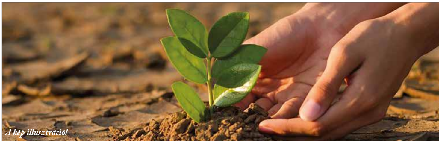
A kép illusztráció!

A klímaváltozás hatásai Magyarországon is érezhetők, beleértve Algyő térségét is. Bár a Golf-áramlás közvetlenül nem éri el hazánkat, gyengülése befolyásolja az európai éghajlatot, így a szélsőséges időjárási jelenségek előfordulása egyre gyakrabban megjelennek a településen is.