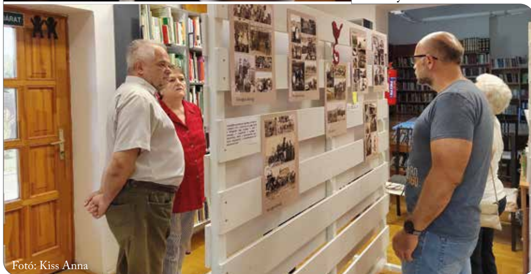
Fotó: Kiss Anna