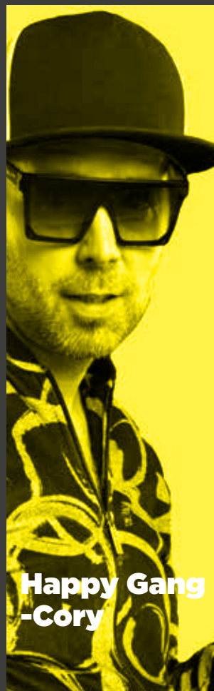
Happy Gang -Cory