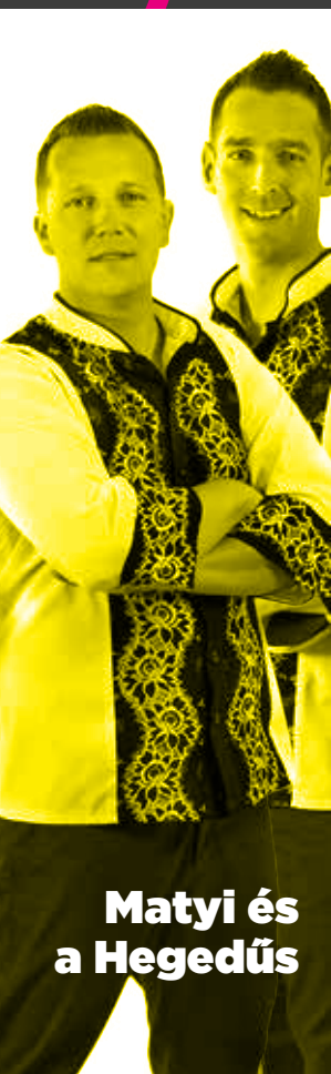
Matyi és a Hegedűs