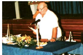
Elnöki beszámoló a 2007 júliusi találkozón