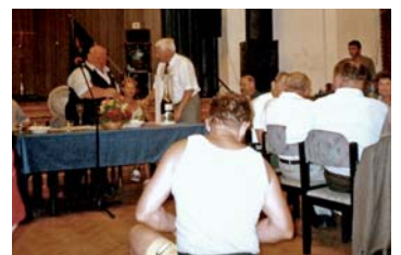
ÖBK a hebertsfeldeni polgármester köszöntése, éremátadással (2005)