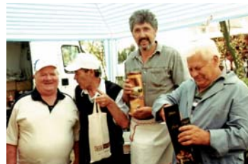
2007-ben a falunapi hallérfőző verseny nyertesei