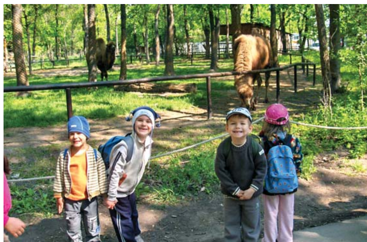
Jaj, de aranyosak!