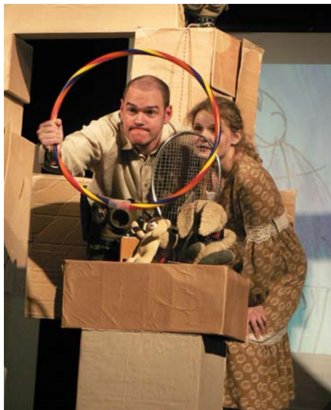
Jelenet a színházi előadásból

A Magyar Kultúra Napja nem tartozik a hivatalos, piros beütés ünnepek közé, de felhívja a figyelmet azokra a tárgyi és szellemi értékekre, melyeket méltán érezhetünk magunkénak. Kölcsey Ferenc 1823. január 22-én fejezte be a Himnusz megírását. Ennek emlékére 1989-től január 22-én a Magyar Kultúra Napját ünnepeljük. Ezen a napon különböző rendezvények emlékeztetnek minket évezredek és kevésbé régi hagyományainkra, gyökereinkre, múltunkra. A faluház munkatársai is különböző programokkal kívánták felhívni a figyelmet azokra az értékekre, amelyeket az évszázadok során sikerült megőrizni.