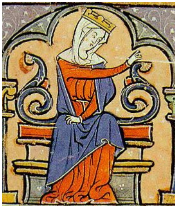
Luca 304 körül élt Syracusában

Az ismert hagyományokat felelevenítve Luca-széket készítenek az Algyői Borbarátok.